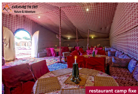
restaurant camp fixe