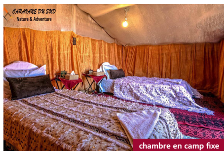
chambre en camp fixe

1 nuit en camp mobile dans l'Oued Naam (jour 4) Bivouac (tentes type igloo avec matelas épaisseur 10 cm) au milieu de nulle part à la belle étoile !